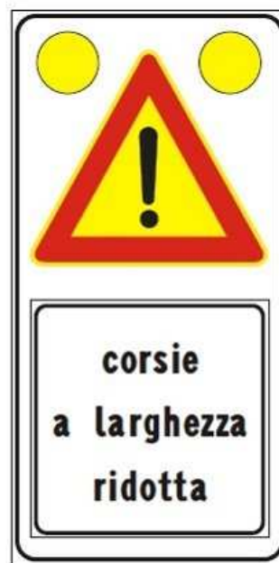
Figura II 391c Art. 31