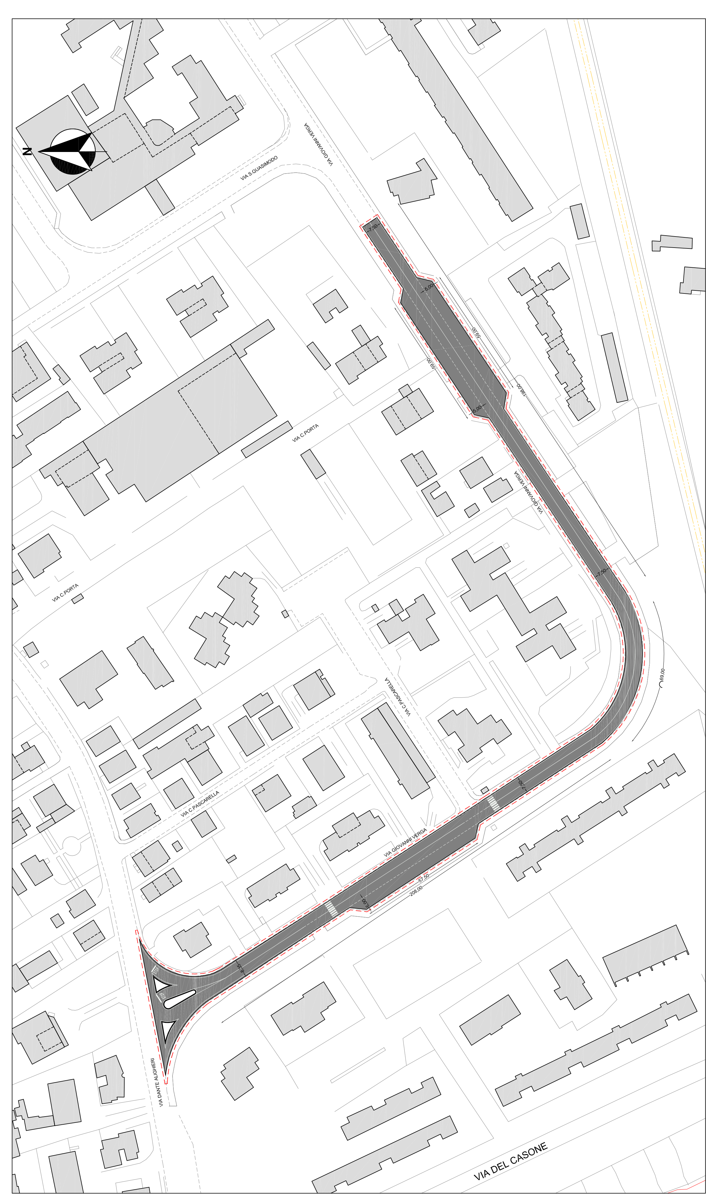
PLANIMETRIA OGGETTO D'INTERVENTO scala 1:1.000