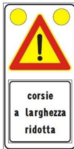
Figura Il 391c Art. 31