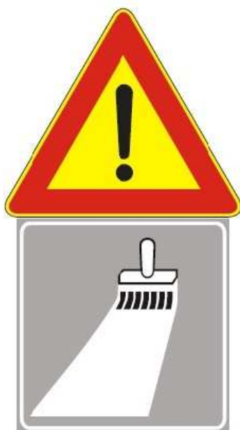
Figura Il 391 Art. 31