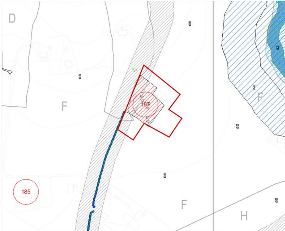
STRALCIO PIANO REGOLATORE ATTUALE

Nello specifico la zona oggetto di variante si trova in contrada Cavallino, al confine con il territorio del Comune di Montecosaro, con destinazione in parte Erv V2 e in parte E3 V2; all'interno dell'area è presente un fabbricato colonico storico censito per il quale il vicolo di tutela rimarrà inalterato anche a seguito di variante. Si ritiene infatti che la variazione a destinazione produttiva finalizzata all'attività ricettiva non sia in contrasto con la presenza di un manufatto agricolo di valore storico-architettonico, ad oggi non più utilizzato per le finalità originarie. L'immobile verrà valorizzato per un uso diverso ma compatibile, mantenendo invariati gli interventi edilizi consentiti così da non stravolgere in alcun modo le caratteristiche architettoniche e compositive dell'area tutelata.