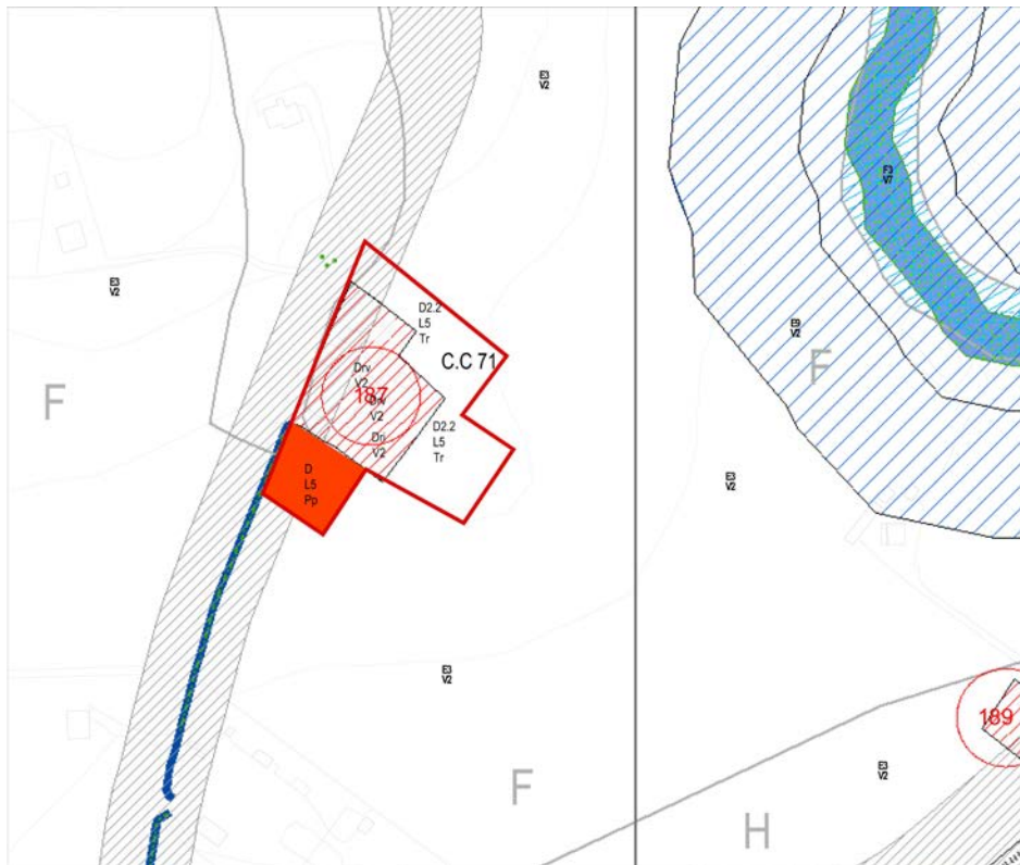
STRALCIO PIANO REGOLATORE PROPOSTA DI VARIANTE

Relativamente alla C.C. 71, si precisa che la necessità degli standard di norma nella nuova destinazione sono stati reperiti nell'ambito della zona di intervento e ampiamente soddisfatti ai sensi del D.M. 1444/68: