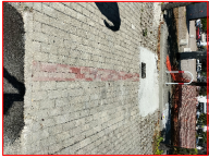
NOVA STRADA CON ACCESSI AUTOMATIZZATI