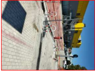
NOVA STRADA ESISTENTE